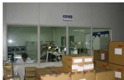
Ruang Inspeksi yang meneliti kualitas produk secara acak sebelum dikirimkan ke distributor dan dealer. Bukti keseriusan Kingston dalam menghasilkan produk yang berkualitas.

Lantai pertama yang kami kunjungi merupakan proses pengepakan dimana modul memori dibungkus secara rapi oleh para pekerja Kingston atau menggunakan mesin untuk pembungkusan kartu memori. Memori kemudian dimasukkan dalam kardus-kardus yang kemudian akan disimpan pada ruang penyimpanan. Memori tersebut telah siap dikirim ke berbagai pelosok sesuai kebutuhan. Terdapat pula ruang pengujian dimana setiap produk diuji secara acak guna mengetahui kualitas produk sebelum dikirimkan. Kami pun diajak untuk melihat dari jauh tempat penyimpanan sebelum kami akhirnya naik ke lantai selanjutnya. Di lantai berikutnya kami melihat beberapa jalur SMT untuk produk memori. Kingston memiliki 12 jalur SMT dimana 65% diantaranya digunakan untuk proses modul memori dan sisanya untuk kartu memori dan USB flash drive. Kingston menerima bahan mentah berupa chip memori yang siap dipasangkan pada rangkaian PCB. Juga terdapat ruangan dimana Kingston menyimpan bahan mentah yakni chip memori sebelum akhirnya dikeluarkan untuk dihubungkan dengan rangkaian PCB.