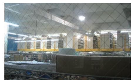
Tampak dalam gambar, ruang penyimpanan produk-produk yang sudah jadi dan siap dikirimkan.

Lantai berikutnya kami menemukan proses produksi untuk kartu memori seperti SD, mini SD dan micro SD. Terdapat proses yang masih dikerjakan oleh manusia satu per satu atau dikerjakan oleh mesin. Mesin tersebut saat ini hanya ada satu dan mengerjakan proses pembuatan kartu memori secara otomatis. Mesin yang ditempatkan pada ruangan yang hanya boleh dimasuki oleh pihak tertentu tersebut diperlihatkan pada kami. Nampak bahwa hampir semua proses tersebut dikerjakan secara sistematis dan hampir semuanya dikerjakan oleh mesin. Kami pun beranjak ke bagian pengujian yang nampak seperti ladang dimana terdapat banyak sistem dimana setiap memori dihubungkan pada board yang telah dipasang modul khusus sehingga memungkinkan untuk memasang dan mencabut memori walau sistem dalam keadaan hidup. Setelah itu kami pun melihat sebuah tempat dimana terdapat sejumlah notebook yang dihubungkan dengan USB flash drive yang diuji dalam keadaan nyata.