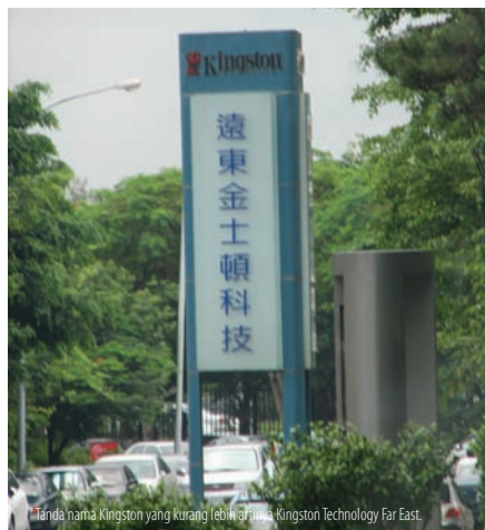
Tanda nama Kingston yang kurang lebih artinya Kingston Technology Far East.

Saat pameran Computex 2007, Kingston mengajak para jurnalis menengok pabriknya di Taiwan yang terletak di Hsinchu Science Park. Kami diajak untuk melihat rahasia dapur Kingston yakni proses dari chip memori hingga modul memori yang kita gunakan dalam komputer kita masing-masing. Kingston yang ditandai dengan logo Redhead atau "Rex" baru saja mencapai US$ 3,7 milyar untuk penjualan tahun 2006, dan merupakan kenaikan US$ 700 juta dibanding penjualan tahun 2005. Tahun 2007 ini, Kingston merayakan ulang tahunnya yang ke-20 dan telah memiliki lebih dari 3300 karyawan diseluruh dunia. Pabrik Kingston yang di Taiwan ini memiliki kemampuan produksi hingga 4,5 juta unit per bulannya namun belum mulai memproduksi DDR3 saat ini.