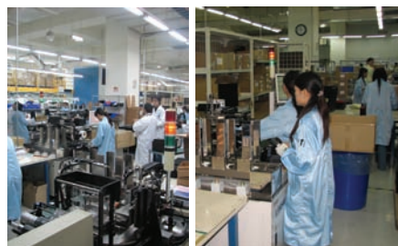
Dalam gambar terlihat para pekerja Kingston sedang mengopak produk modul memorinya. Terdapat juga sistem otomatis yang digunakan untuk mengopak USB flash drive.

Sesampainya kami disana, kami langsung memasuki gedung Kingston yang memiliki 5 lantai. Setelah kami mengenakan baju anti statik dan dibagikan kartu tanda masuk, kami pun diajak untuk menengok seluk beluk pabrik Kingston.