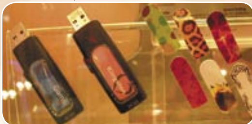
Flash disk yang bisa ditempel stiker pribadi.