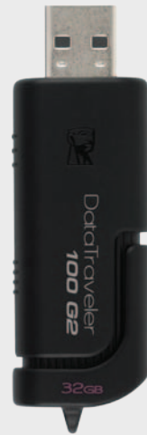
DataTraveler 100 G2