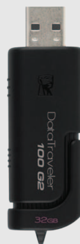
DataTraveler 100 G2