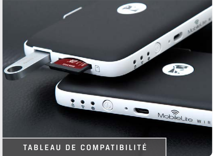
TABLEAU DE COMPATIBILITÉ

MUSIC WIRELESS SHARE WI-FI WIRELESS SHARE PHOTOS WIRELESS SHARE FLASH WIRELESS SHARE STORAGE WIRELESS SHARE STORAGE WIRELESS SHARE PHOTOS WIRELESS SHARE