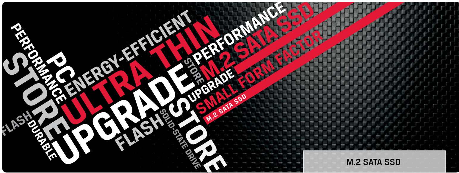
M.2 SATA SSD